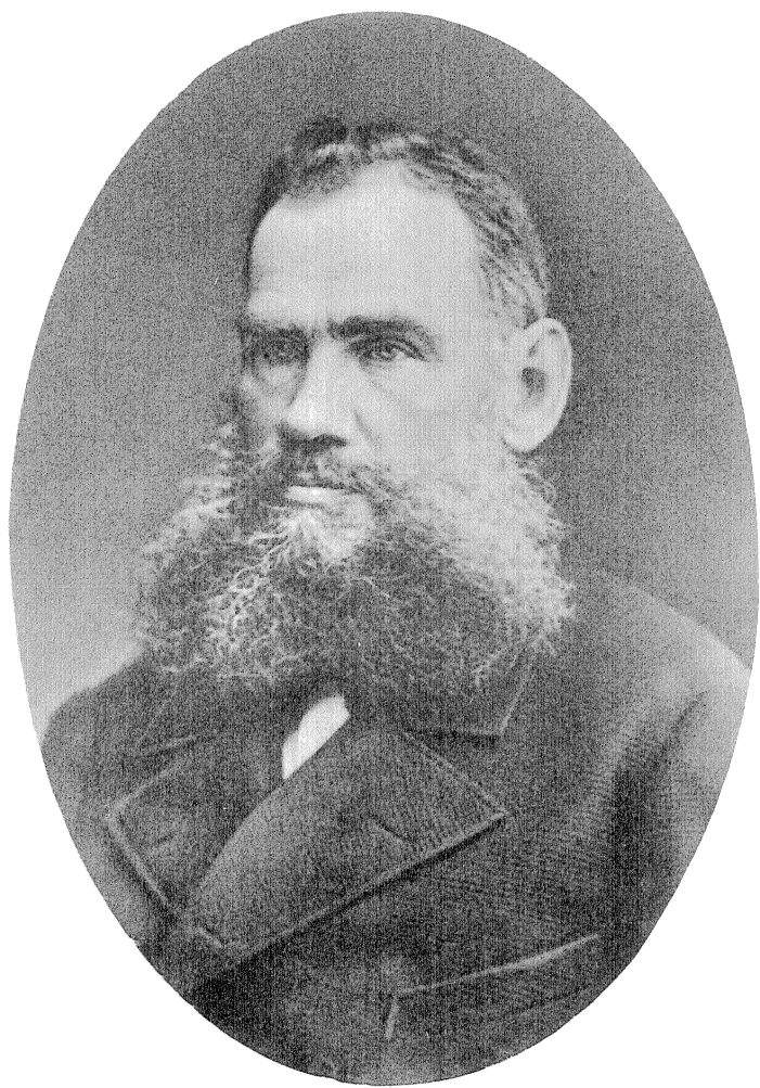
Л. Н. ТОЛСТОЙ в 1881 г.