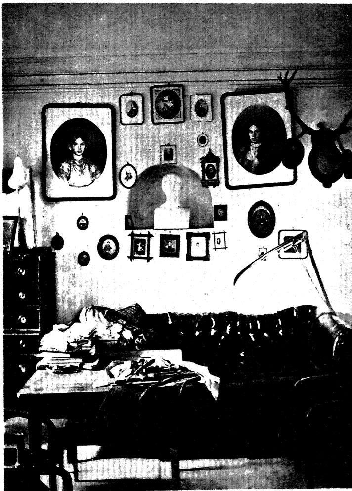
КАБИНЕТ ТОЛСТОГО В ЯСНОЙ ПОЛЯНЕ В 1871—1889 гг. (1887 г.)