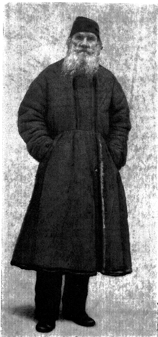
Л. Н. ГОЛІСТОИ Февраль 1897 г.